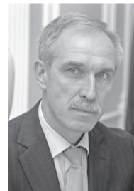
Губернатор Сергей Морозов:

“ Регион вообще может отказаться от этого проекта (создания самолета DHC-6 Twin Otter). По крайней мере, мы у себя в регионе такое решение приняли. Есть огромное желание у наших европейских и российских партнеров прийти на особую экономическую зону. Тот земельный участок, который мы готовили под это предприятие, в ближайшее время передадим ”